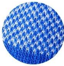
PERFORMANCE KNIT: DURABLE SOCKS WITH AIR FLOW

Panels of porous knitting promote airflow and convey a fashionable style