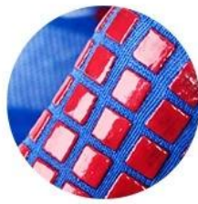
HIGH QUALITY GRIPS: PREVENTS SLIDING ON THE TRAMPOLINES

Panels of porous knitting promote airflow and convey a fashionable style