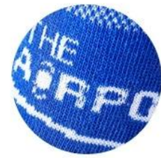
CUSTOM DESIGN: PROMOTE YOUR BRAND

Our designers can help develop a unique style for your park.