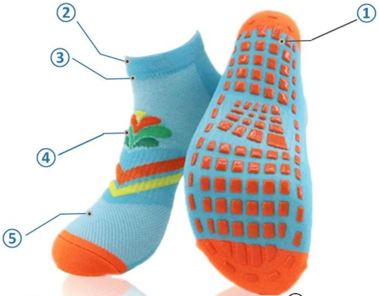
① Grips resistant and non - slip